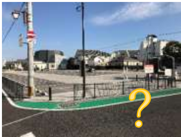
市営大手前第2駐車場 100台 閑散としている

なかまち駐車場には駐車スペースがない 旧市営第2 駐車場も現在は駐車できない 「まちづくり佐伯」も駐車スペースが少なく、また案内表示も小さく分かり辛い これでは、仲町通りまた新町通り、うまいもん通りへの訪問を困難にし敬遠する要因となっ ている。