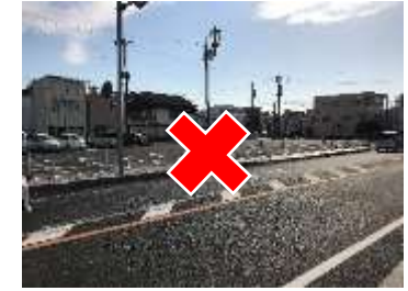
旧市営第2駐車場 50台