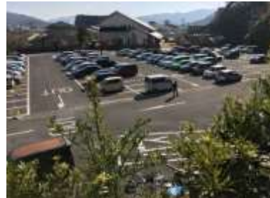
文化会館下市営駐車場 150台 平日でもほぼ満車